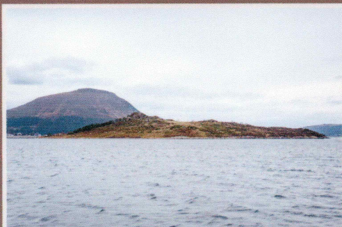
Hestøya (i forgrunnen) ved Lepsoya. Her ble skipet ført på land etter å ha blitt angrepet av engelske fly.