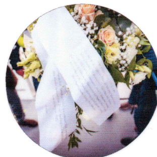
Blomsteroppsatsen som ble satt på havet ved Hestøya, til minne om de 16 som omkom på «Eira».